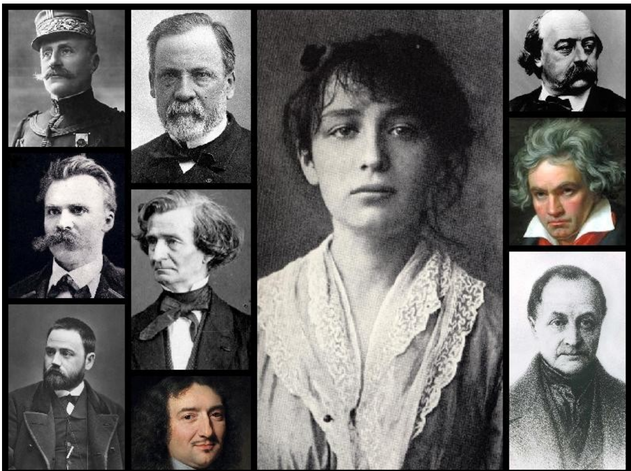
Quelques Passionnés historiques de l'étude