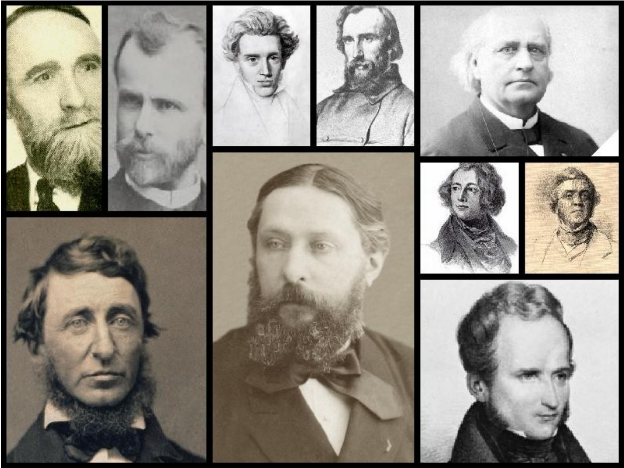
Quelques Sentimentaux historiques de l'étude