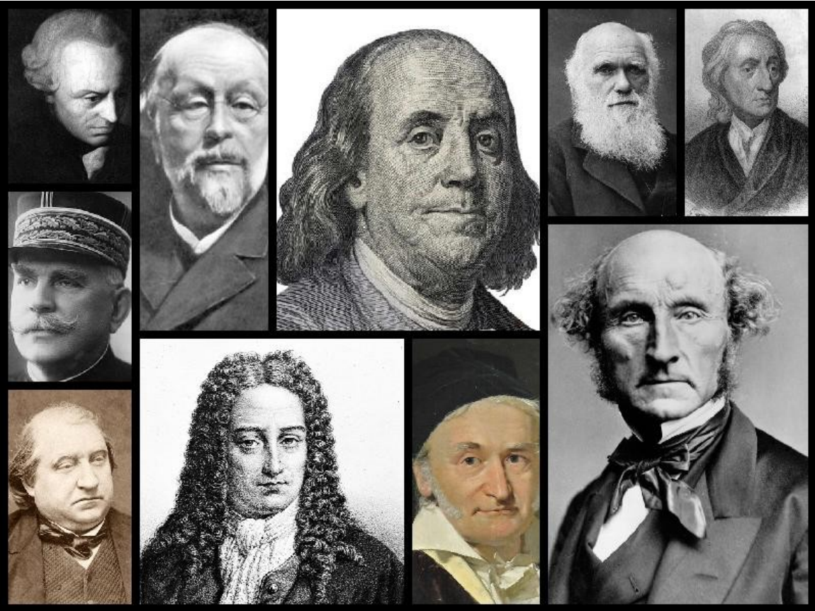
Quelques Flegmatiques historiques de l'étude