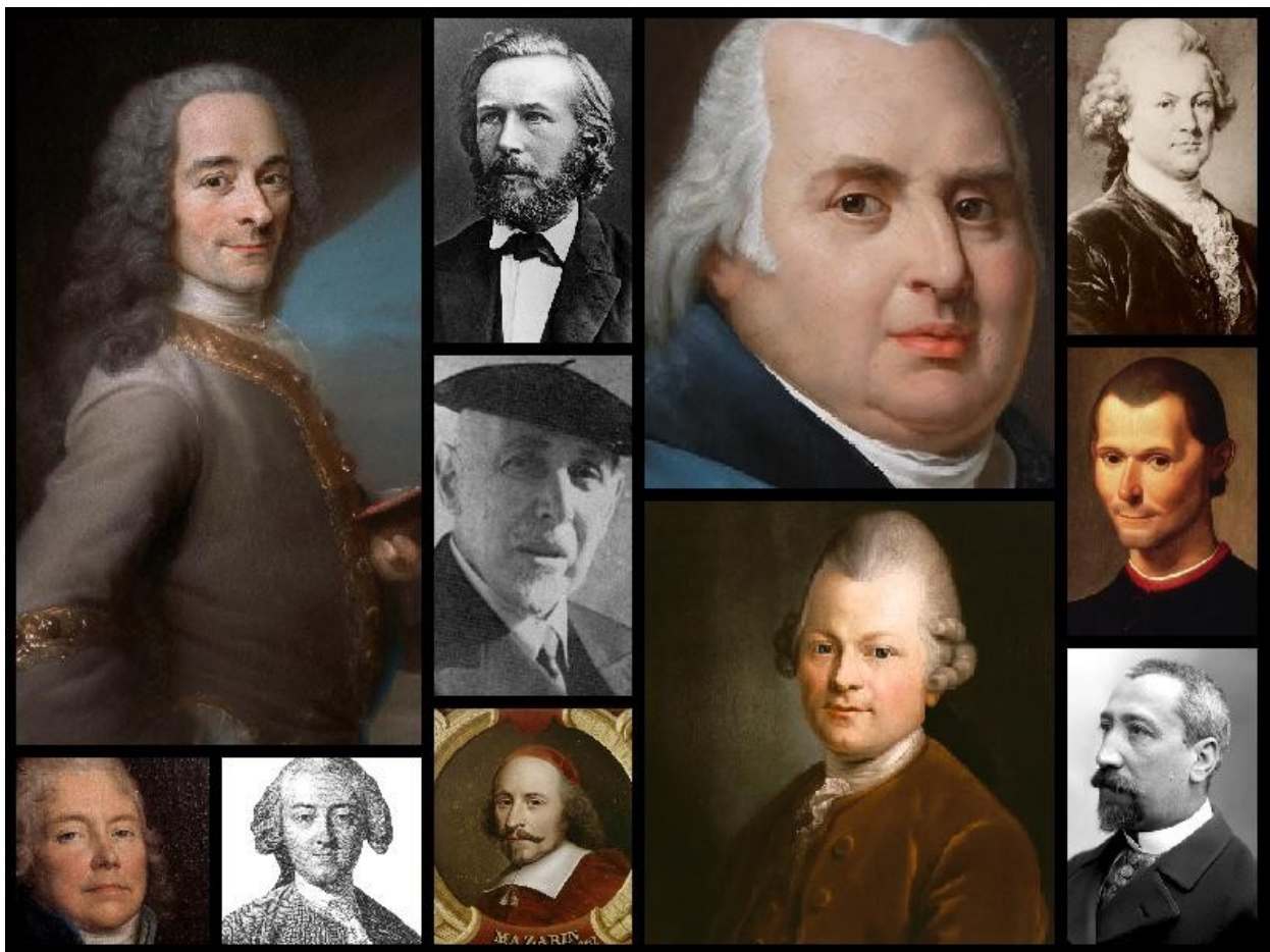
Quelques Sanguins historiques de l'étude

Concernant enfin la fonction de retentissement , la Lune, astre le plus rapide du planétaire, symbole du changement et de la mobilité, serait primaire ; à l'opposé, Saturne, astre le plus éloigné et le plus lent, planète de « la science » et du « sérieux », serait secondaire .