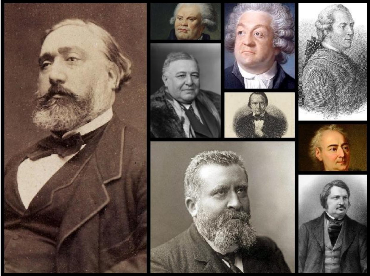
Quelques Colériques historiques de l'étude